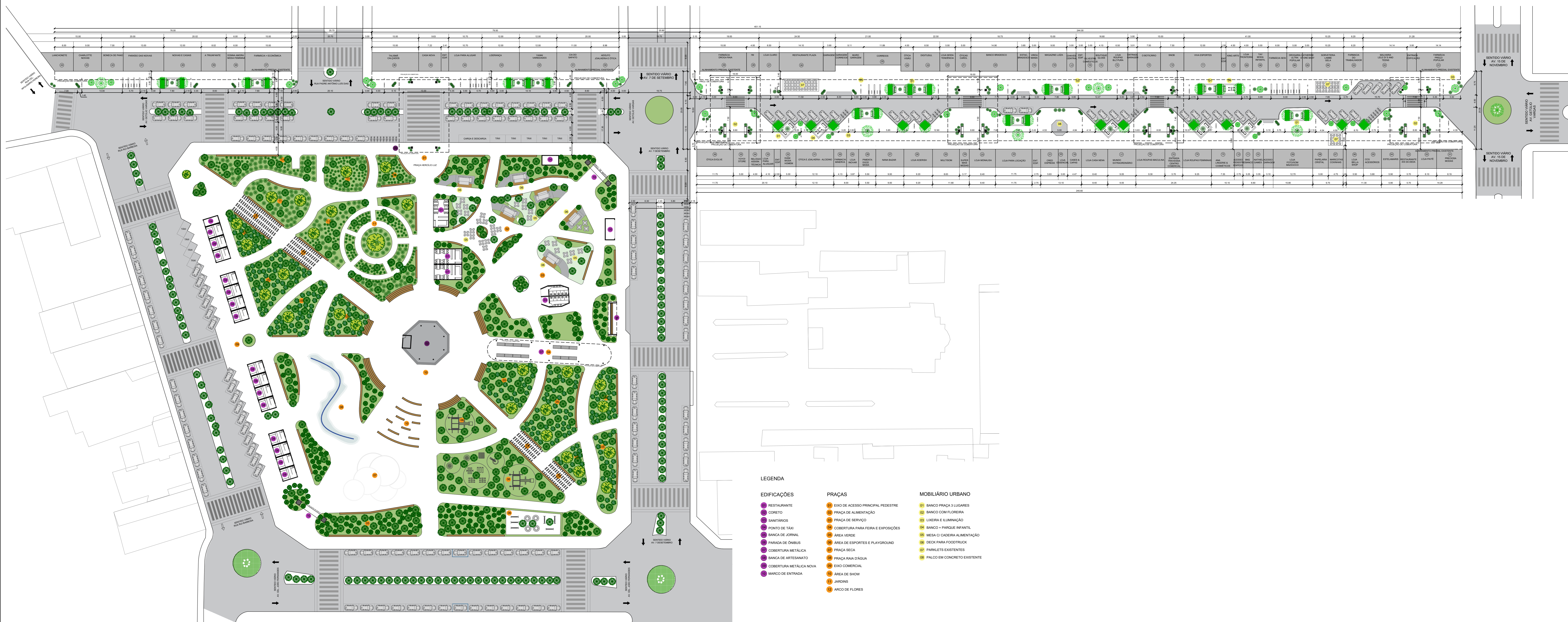
PLANTA BAIXA ESC. 1/500