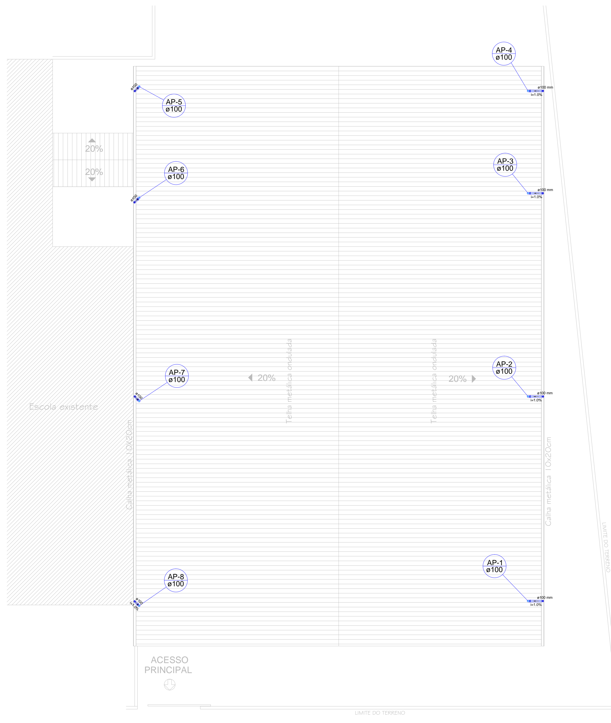
Planta - Cobertura Esc.: 1:100